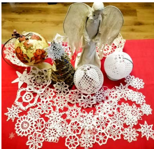
Świąteczne ozdoby KGW w Mętowie.