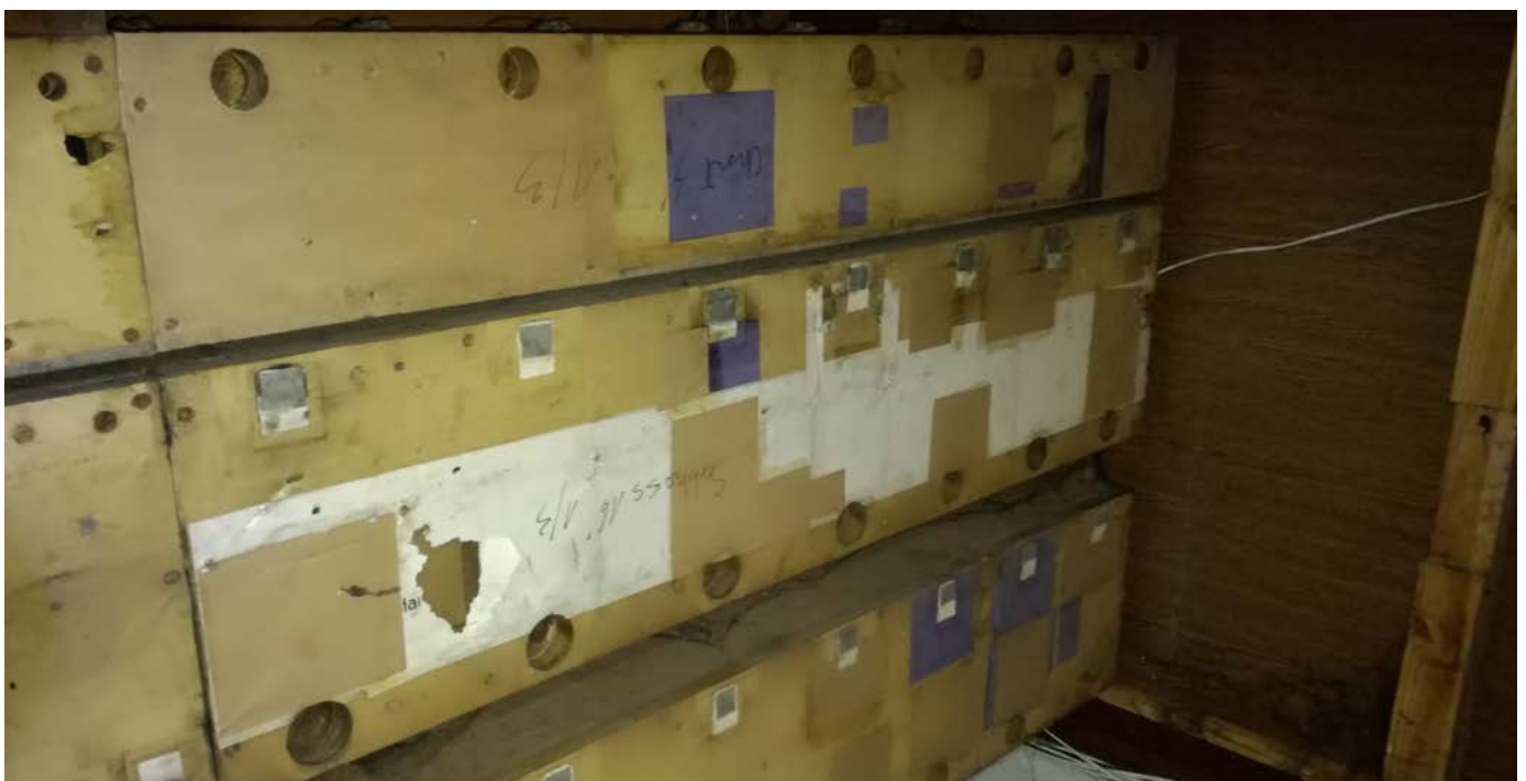
Stan membran wiatownicy pedałowej przed remontem.