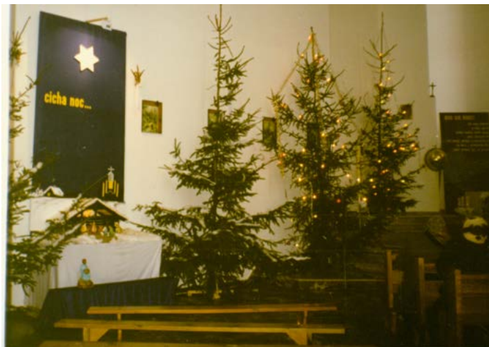
Bożonarodzeniowy wystrój kościoła z okresu budowy. Zdjęcie z archiwum parafii