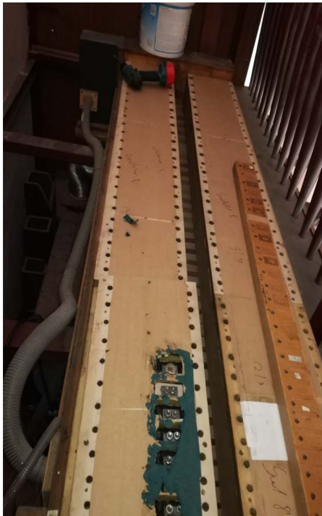
Stan membran wiatrownicy II manualu przed remontem