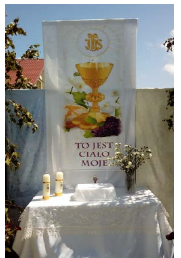
Procesja Bożego Ciała w 2020 roku.