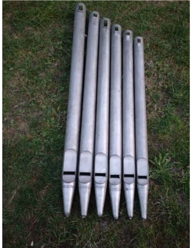
Piszczałki oktawy 4 po naprawie.