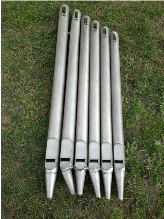
Piszczałki oktawy 4 przed naprawą.