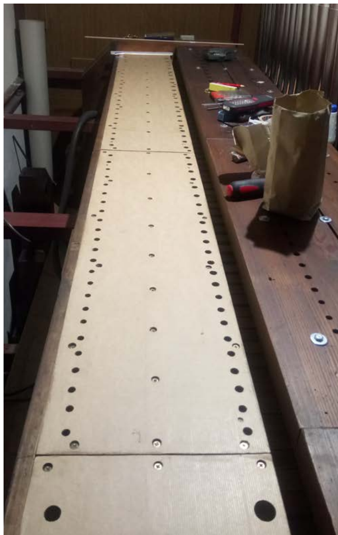
Stan membran wiatrownicy II manualu po remoncie.